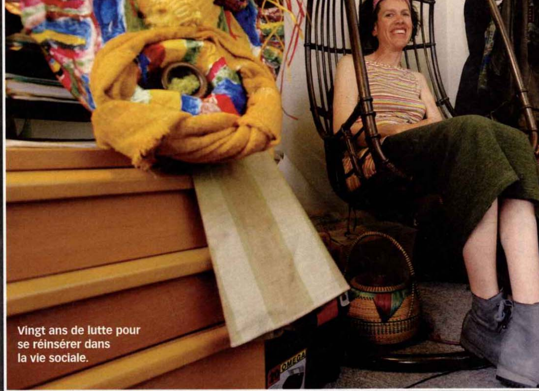
Vingt ans de lutte pour se réinsérer dans la vie sociale.

l'ancien taulard se retrouve aujourd'hui au social, avec 1200 francs par mois, loyer payé. «C'est pas assez pour manger à ma faim, mais si je recevais plus, je grillerais tout pour faire la fête!» Et de reprendre une citation d'Ian Dury, figure mythique de la new wave: «Faut être chaud ou froid. Si tu es tiède, le Seigneur te recrachera de la bouche.» Ce n'est pas le fait de jouer la comédie qui plaît le plus à cet érudit en histoire